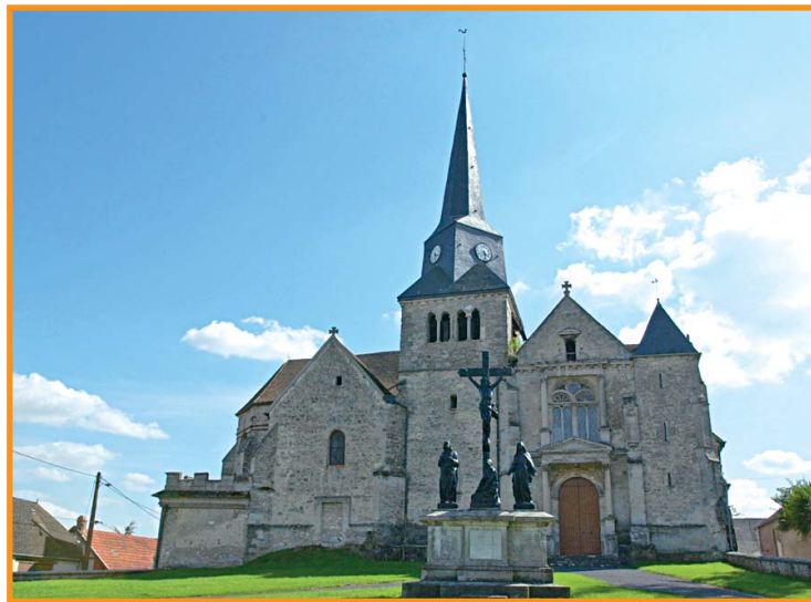
Église de Saint-Erme. -S. Lefebvre-

Ici, le paysage devient différent de celui des autres balades, plus varié et vallonné, charmeur autour de Courtrizy. Adossées aux contreforts du Chemin des Dames, les buttes du mont Héraut, de Montaigu et de Saint-Erme ainsi que les grands pins forment le décor de cette balade.