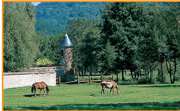
Le château de Mauregny-en-Haye.

Vallonné, ce circuit commence au milieu des cultures, puis passe au pied du mont Hérault avant de traverser Mauregny-en-Haye, entre l'église Saint-Martin et l'horloge du château.