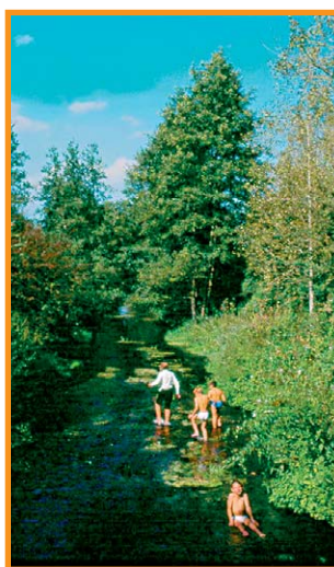
Des baigneurs dans la Souche à Liesse.

D Place de la mairie à Chivres-en-Laonnois. Prendre la direction de Mâchecourt en passant devant l'église. 1 Suivre le chemin à gauche au n° 39 après la voie ferrée. 2 Virer à droite dans l'angle d'un petit bois. Traverser une route et poursuivre en face. Après le point de vue sur le marais Saint-Boétien et le domaine du Marais (ancien château), obliquer à droite. 3 À Mâchecourt, suivre à droite la direction de Cuirieux et, à 80 m, prendre le chemin goudronné des Aulnes vers le domaine du Marais. 4 Après environ 400 m, en vue de la ferme (ancien château), tourner à droite sur un large chemin. 5 À l'intersection, partir à gauche. Le chemin vire à droite puis continue tout droit dans les marais Saint-Boétien. 6 Traverser la rivière de la Souche et continuer entre deux haies de peupliers. 7 À un important croisement, tourner à gauche (propriétés privées) sur une longue piste. 8 2 km plus loin (barrières), face à un champ, emprunter le chemin à gauche puis passer la voie ferrée. 9 Traver-