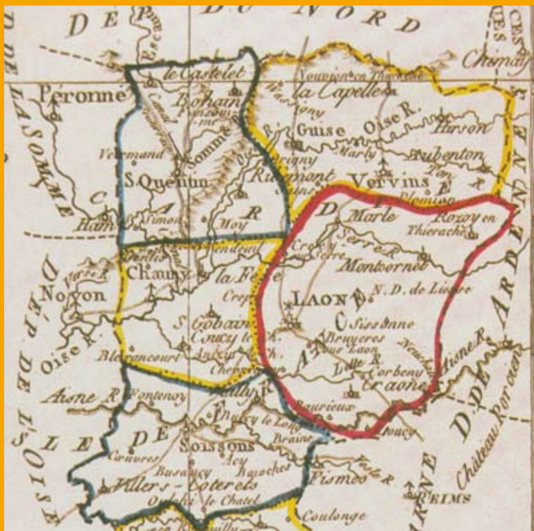
Sur la carte de l'Aisne en 1794, Liesse et Roucy sont encore des chefs lieux de canton. (document Archives de l'Aisne).

Longtemps siège du juge de paix, le canton n'est plus aujourd'hui qu'une circonscription électorale pour l'élection au Conseil général. La réforme en cours prévoit l'élection en 2014 de 26 conseillers territoriaux pour l'Aisne siégeant à la fois au Conseil général du département et au Conseil régional.