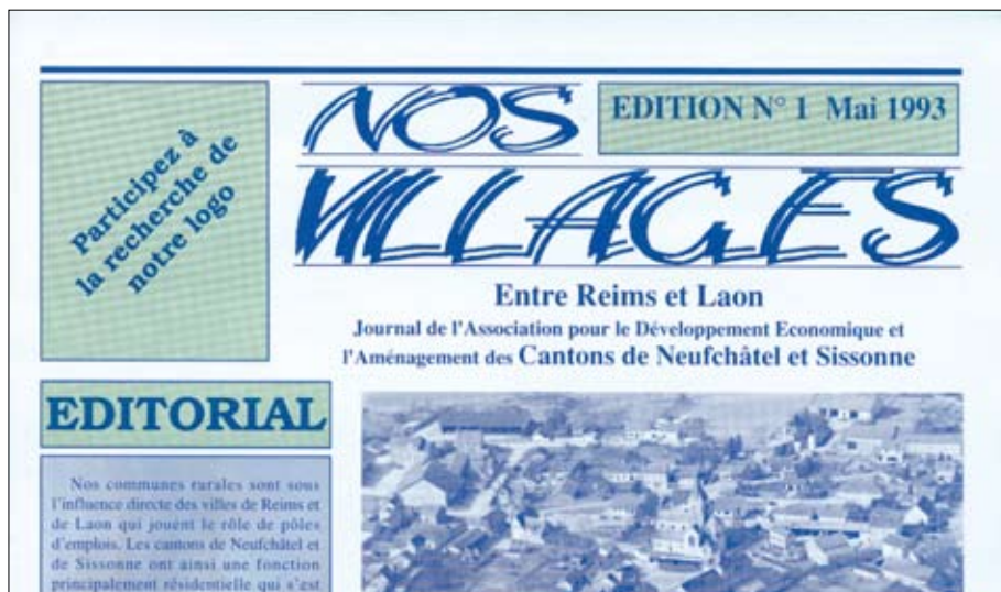
Mai 1993 : le premier numéro d'un journal commun au 2 cantons.