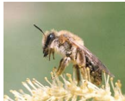
Le musée de l'abeille transféré à Liesse.

À Liesse-Notre-Dame, c'est le musée vivant de l'Abeille qui s'est ouvert dans nos locaux récemment. Transféré de Corbeny, le musée propose des visites de l'exposition «l'abeille vivante» ainsi que des caves à hydromels.