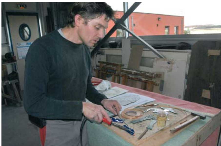
L'artiste au travail.

Pour lui, cette pratique traduit un état d'âme, un état d'esprit et est devenu un réel art de vivre. Désormais, il allie sa passion à son travail, et la transmet à des élèves.